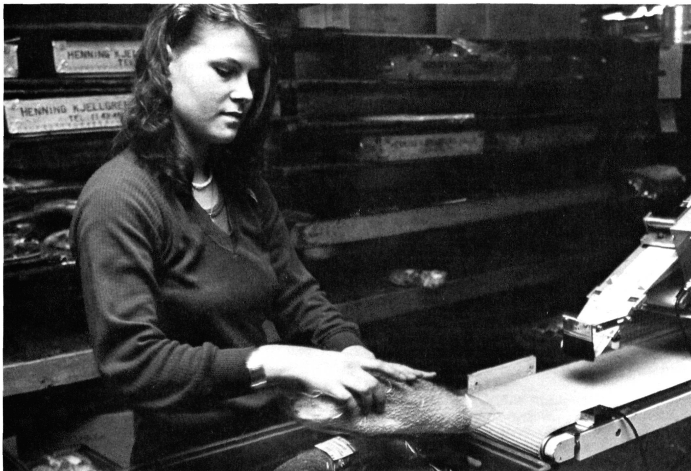
Feriearbete räknas inte som förvärvsarbete